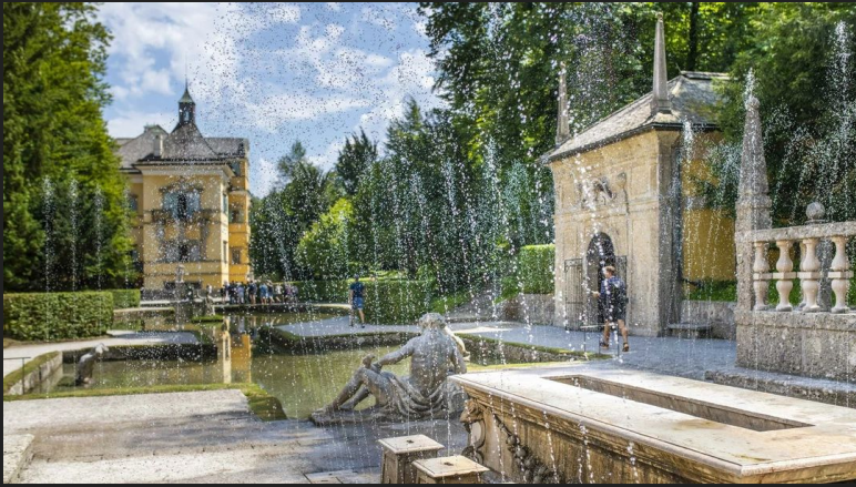
Pałac i ogrody wodne uciech Hellbrunn