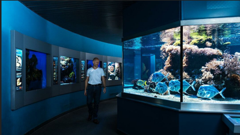
Muzeum Historii Naturalnej