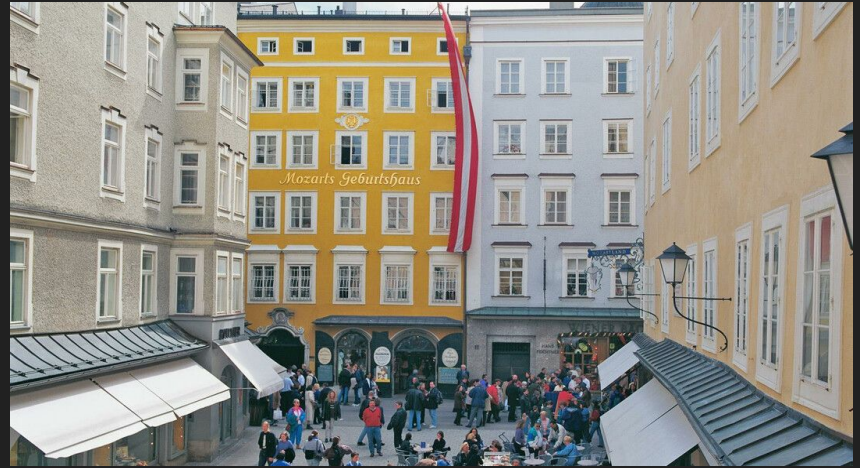
Dom Urodzenia Mozarta